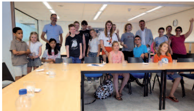
Leerlingen van de Resonans-scholen gaven input voor het nieuwe strategische plan.